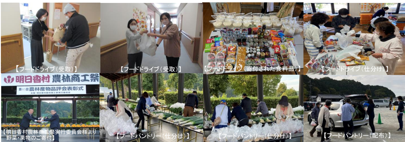
【フードドライブ(受取)】