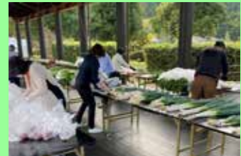
【野菜等の仕分けの様子】