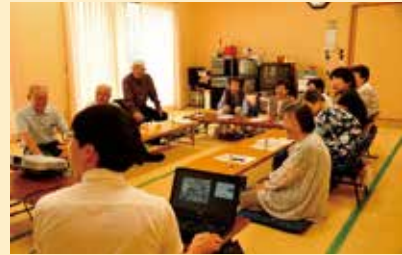
【ふれあいいいききサロンの様子】

村内の福祉に関する情報や社協の活動を掲載した広報誌「社協だより あすか」を発行しました。