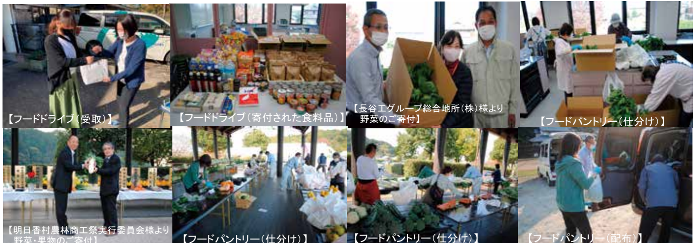
【フードドライブ(受取)】