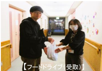
【フードドライブ(受取)】