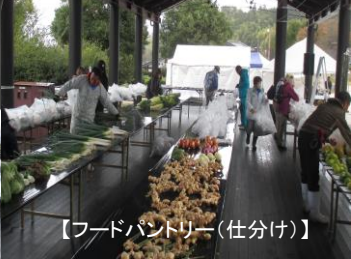
【フードパントリー(仕分け)】