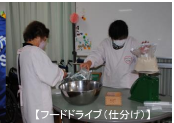
【フードドライブ(仕分け)】