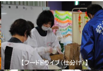
【フードドライブ(仕分け)】