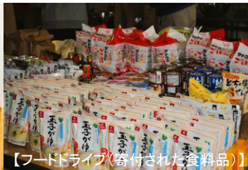
【フードドライブ(寄付された食料品)】