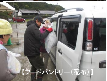
【フードパントリー(配布)】