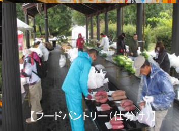
【フードパントリー(仕分け)】