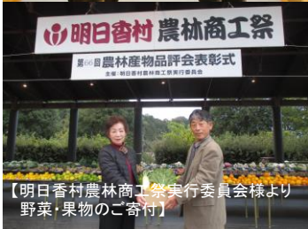
【明日香村農林商工祭実行委員会様より野菜・果物のご寄付】